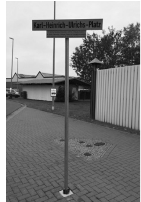
Karl-Heinrich- Ulrichs-Platz Aurich