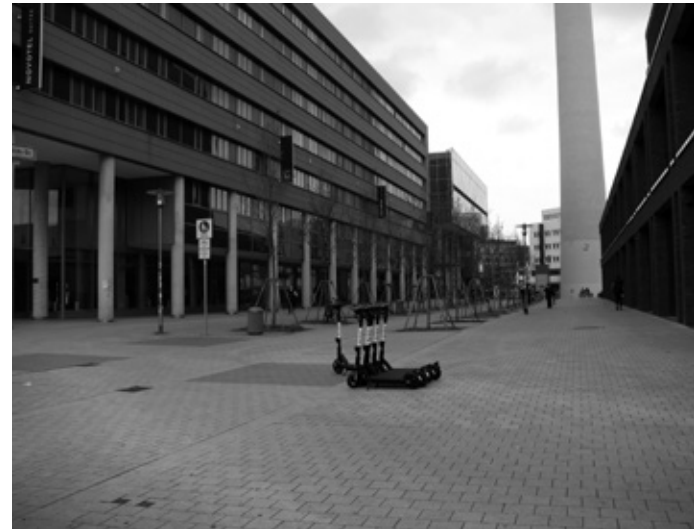
Blick von der RundestraÙe in die Karl-Heinrich-Ulrich-StraÙe Hannover

Während in München der lokale Bezug Ulrichs zur Stadt erst im zweiten Anlauf anerkannt und mit der Platzbenennung gewürdigt wurde, hatten es vergleichbare Initiativen in Frankfurt am Main, Stuttgart und Hannover etwas leichter. Denn dort war Ulrichs, wenn auch nur für jeweils einige Jahre, beheimatet oder, wie in Hannover, beruflich mit der Region verbunden. 1852 hatte Ulrichs sein Amtsassessor-examen in Hannover abgelegt und war dann als Gerichts-