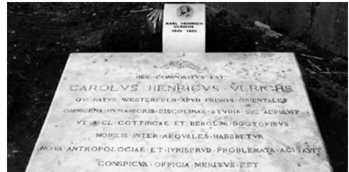
Grabplatte von Karl Heinrich Ulrichs auf dem Cimitero monumentale dell’Aquila neben dem Mausoleum seines letzten Gastgebers, Niccolò Persichetti.