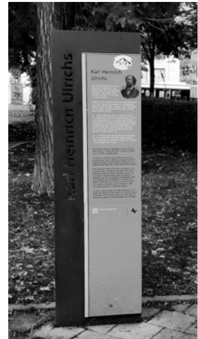
Ulrichs-Stele auf dem Karl-Heinrich- Ulrichsplatz in Stuttgart.