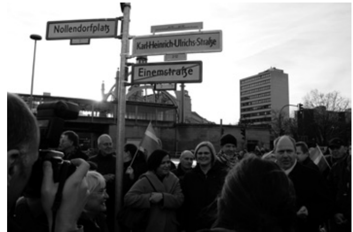
Umbenennung der Berliner Einemstraße

Doch kaum beschlossen, wurde auch schon geklagt. Die Einem-Straße liegt nicht vollständig im Bezirk Tempelhof-Schöneberg, sondern zu einem Teil im Bezirk Tiergarten, und dort stieß sich eine Anwohnerin daran, dass der neue Name nicht der einer Frau sei und die Wahl des Namens-